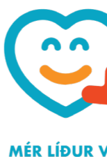
MÉR LÍÐUR VEL