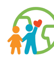
VIÐ OG JÖRÐIN