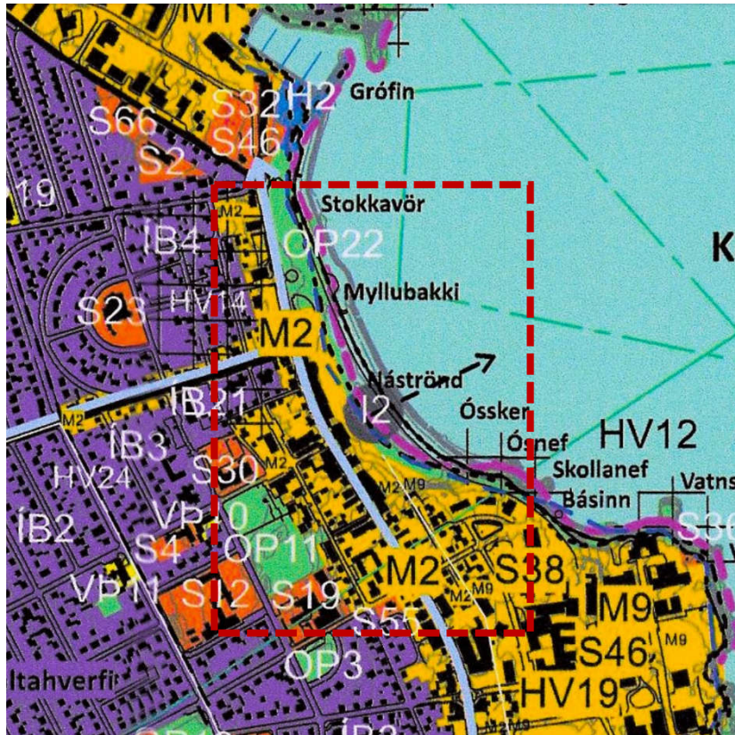
MYND 4 Landnotkun samkvæmt Aðalskipulagi Reykjanesbæjar 2020-2035. Heimild: Aðalskipulag Reykjanesbæjar 2020-2035 – hluti af þéttbýlisupprætti m.sbr.