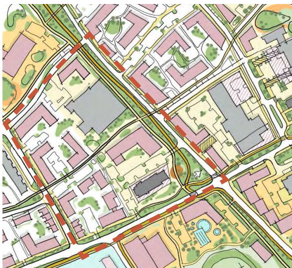
Skýringarmynd frá rammaskipulagi ALTA

Deiliskipulagið sem um ræðir nær yfir svæði sem er afmarkað af Flugvallarbraut til norðurs, Grænasbraut til suðausturs, Breiðbraut til suðvesturs og lóðamörkum aðliggjandi lóðar til norðausturs. Lóðarstærð og mörk verða ákveðin í samráði við KADECO. Deiliskipulagssvæðið er miðsvæðis á Ásbrú og fellur í raun undir tvö svæði í rammaskipulaginu, annars vegar Hjartað og svo Offiserahverfið. Uppbygging á þessum vel staðsetta reit, getur sett gott fordæmi fyrir framtíðaruppbyggingu á Ásbrú.