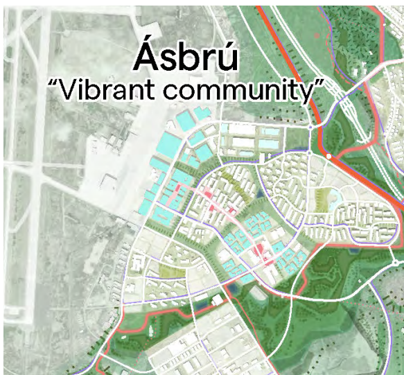
Yfirlitsmynd frá þróunaráætlun K64

Rammaskipulag Ásbrúar, “Ásbrú til framtíðar” sem Alta ráðgjöf vann í samstarfi með Kadeco og Reykjanesbæ byggir á samskonar hugmyndafræði og er mikilvægur leiðarvísir fyrir áframhaldandi skipulagsvinnu á Ásbrú.