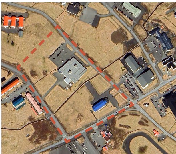
Loftmynd af svæði