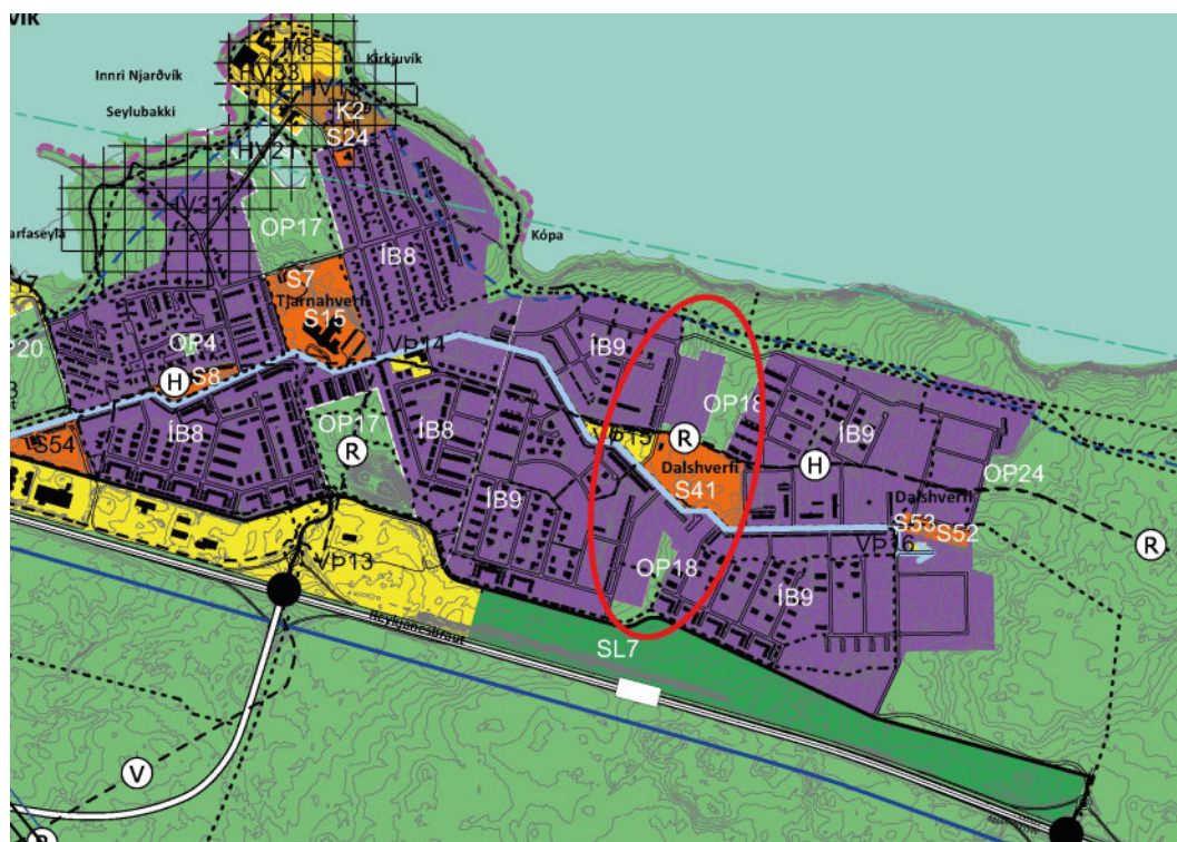
Mynd 7. Tillaga að breytingu á aðalskipulagi Reykjavíkur: