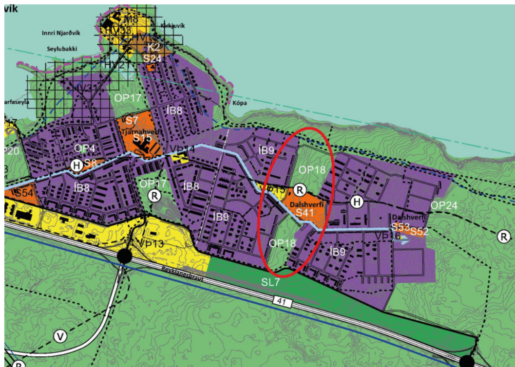
Mynd 6. Gildandi aðalskipulag Reykjavíkur:

Aðalskipulagsbreytingin felur í sér breytingu á þéttbýlisuppdrætti.