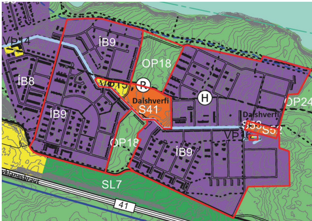
Mynd 3. Afmörkun ÍB9 og OP18 á gildandi þéttbýlisupprætti.