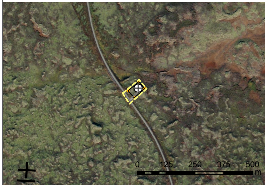
Yfirlitsmynd í mkv. 1:10.000