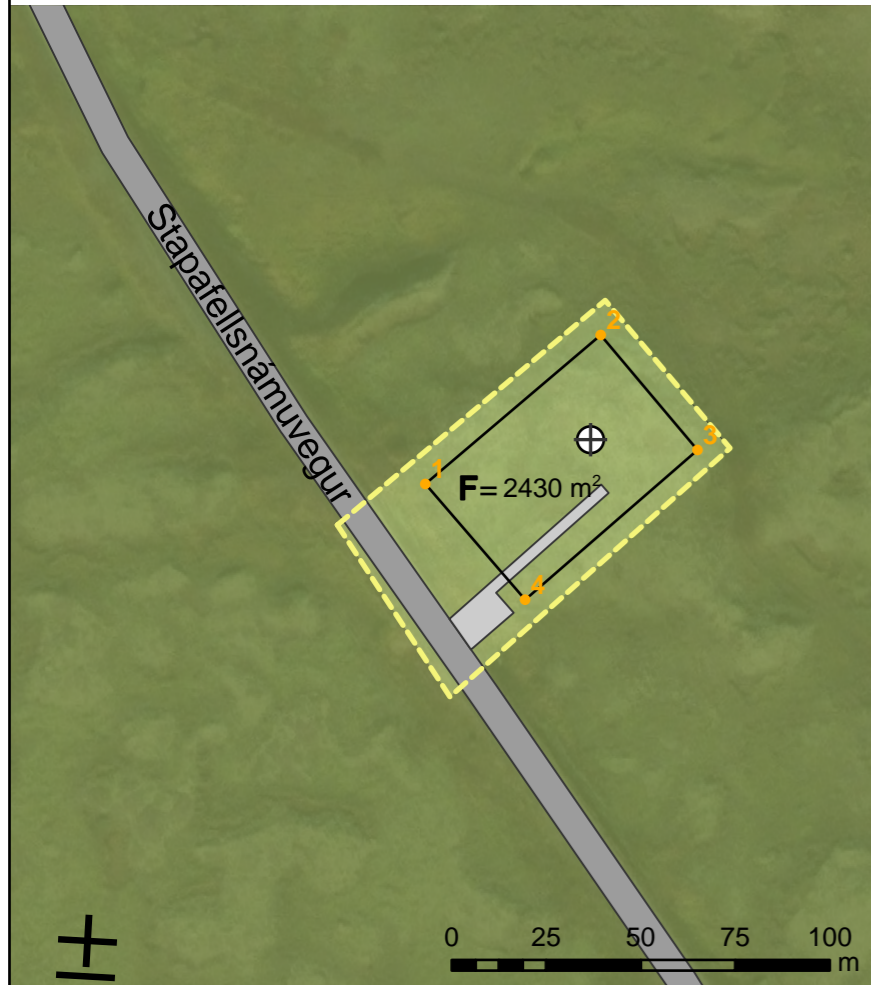
Deiliskipulag í mkv. 1:2.000