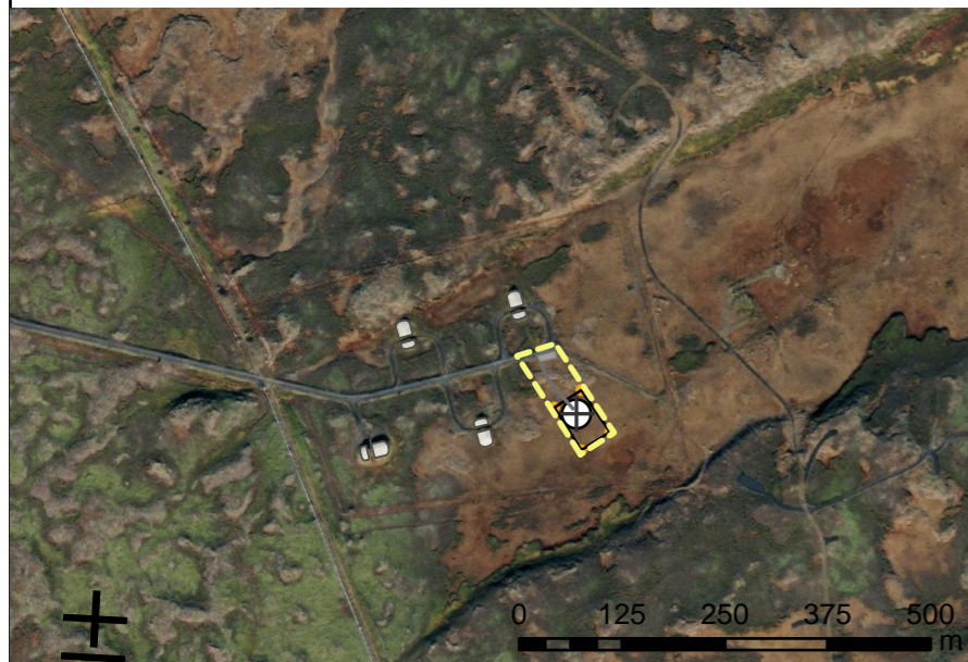
Yfirlitsmynd í mkv. 1:10.000