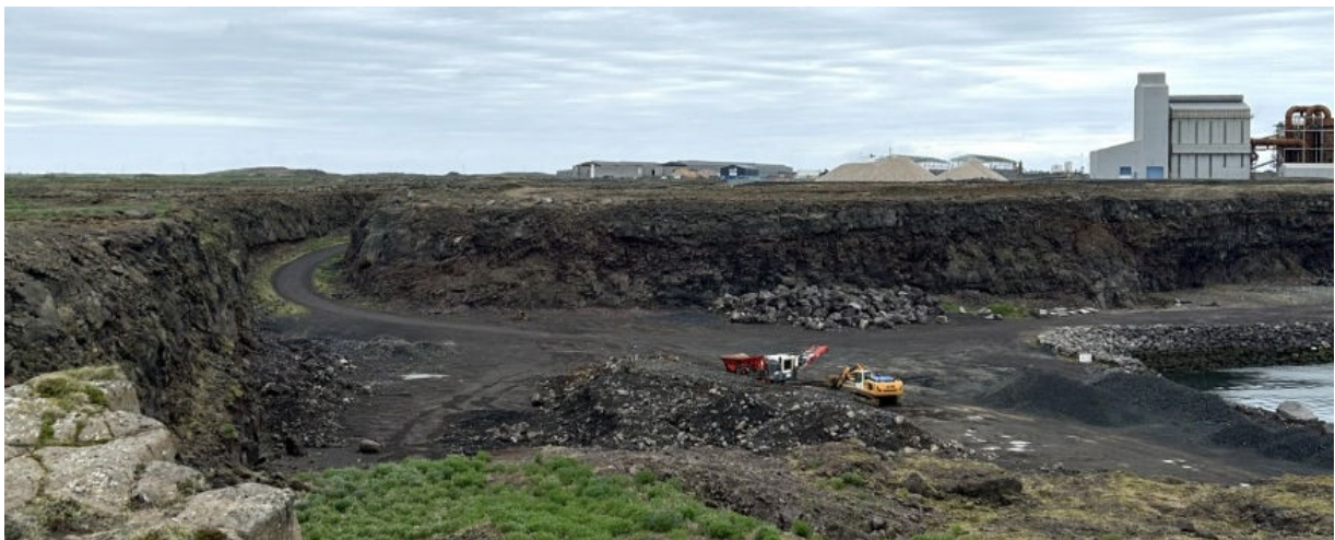
MYND 4 Lóðin Stakksbraut 15 í júní 2024.

Í gildi er deiliskipulagið Helguvík, iðnaðar- og athafnasvæði frá 1994 með síðari breytingum, en lóðum við Stakksbraut var síðast breytt árið 2015. Breytingar verða gerðar á lóðinni Stakksbraut 15 og Stakksbraut 4, sbr. mynd 5. Breytingar á Stakksbraut 15 snúa að því að uppfæra byggingarskilmála til þess að koma megi fyrir starfsemi fyrir inn- og útflutning malaðra steinefna og íblöndunarefna. Á lóðinni er fyrirhuguð mölun, sigtun, íblöndun vigtun og geymsla náttúrulegra jarðefna og íblöndunarefna. Starfsemin fer fram innan- og utanhúss og er starfsleyfis skyld. Skv. núgildandi almennum skilmálum eru hámarkshæðir bygginga 20 m fyrir hús á einni hæð, en 28m fyrir tveggja hæða hús. Lóð verður stækkuð og heimilað verður að byggja hærri byggingar s.s. síló. Í deiliskipulaginu verður gerð grein fyrir þeirri landmótun sem þarf á lóðinni til að koma starfseminni fyrir.