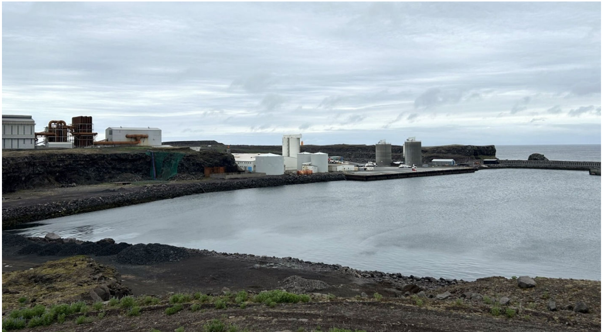
MYND 2 Helgavík í júní 2024.

Landhelgisgæslunnar. Þær breytingar sem hér eru kynntar tengjast ekki lögnum sem eru á austurhluta hafnarsvæðisins.