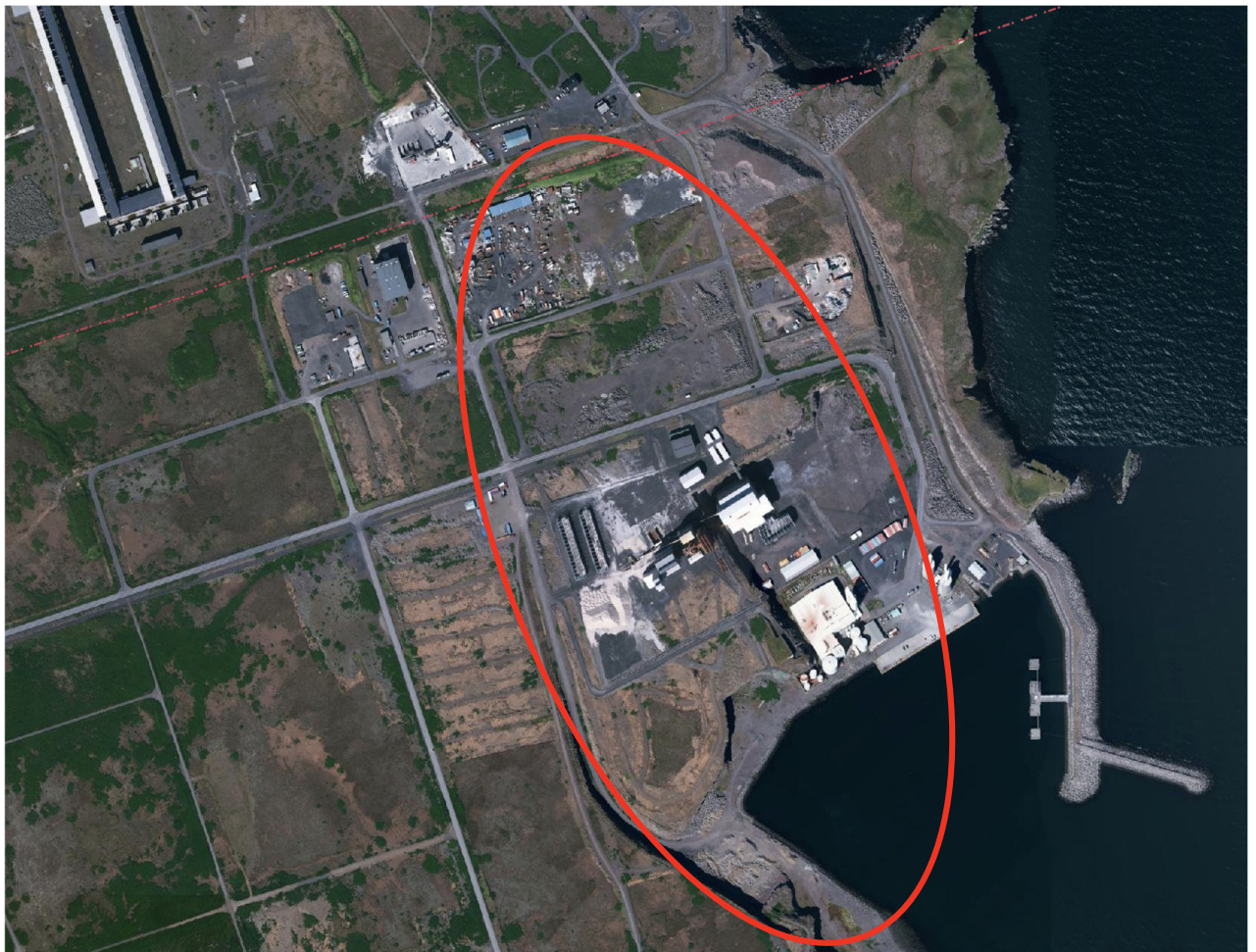
MYND 1 Loftmynd af skipulagssvæðinu með áætlaðri afmörkun skipulagssvæðis.