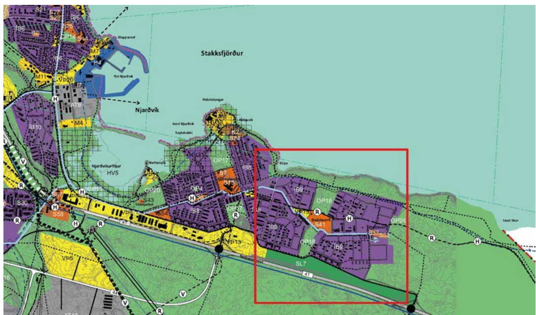
Mynd 1. Staðsetning aðalskipulagsbreytingar á gildandi þéttbýlisupprætti.

Opna svæðið OP18 í Dalshverfi er 9,7 ha að stærð í gildandi aðalskipulagi. Það skiptist í tvo hluta, sá nyrðri er milli Unnardals og byggðarinnar við Seljudal og afmarkast að norðanverðu af Brekadal. Syðri hlutinn er milli Trönudals og Aspardals og afmarkast sunnan megin af Stapabraut. Báðir hlutar liggja að svæðinu S41 í miðju Dalshverfis, þar sem Stapaskóli er.