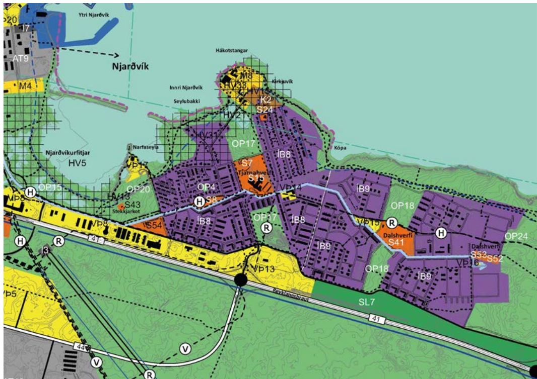
Mynd 5. Tekið úr þéttbýlisupprætti gildandi aðalskipulags Reykjaneshæjar 2020 – 2035.