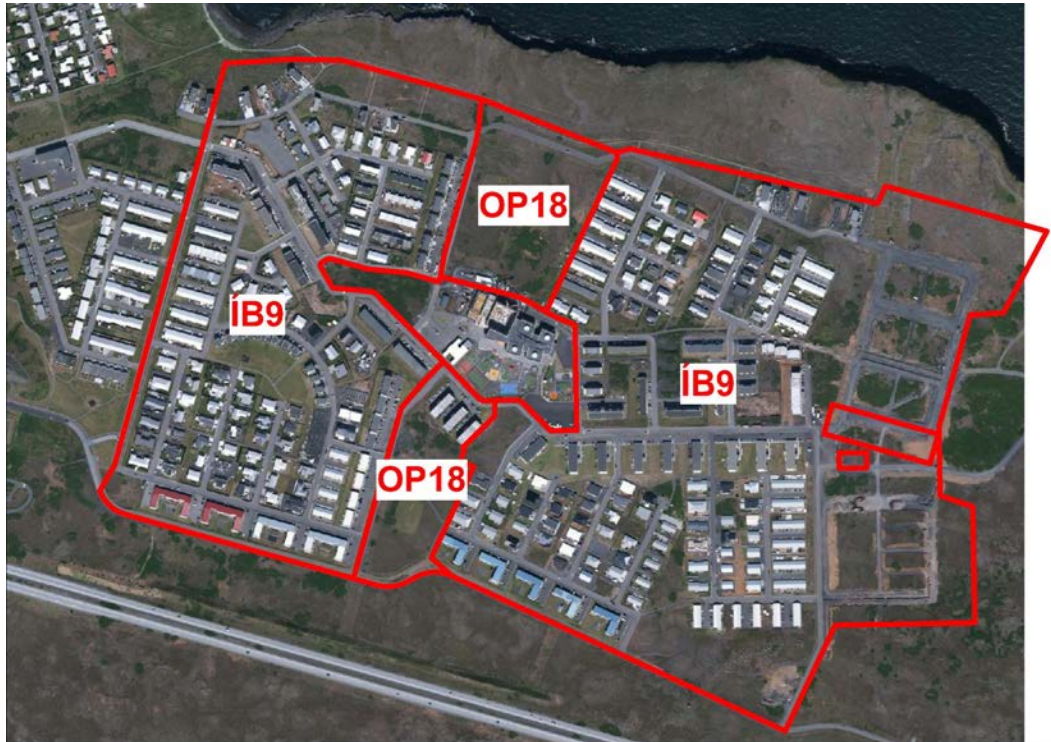
Mynd 2. Afmörkun ÍB9 og OP18 á loftmynd.