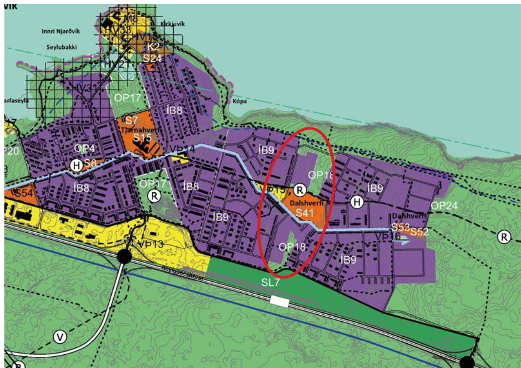
Mynd 7. Tillaga að breytingu á aðalskipulagi Reykjanesbæjar: