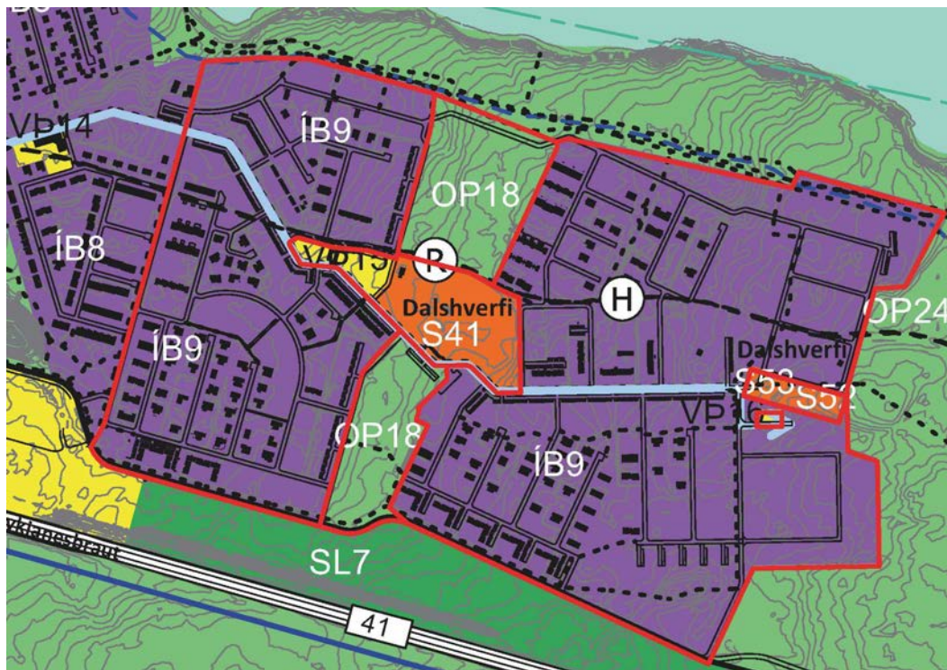
Mynd 3. Afmörkun IB9 og OP18 á gildandi þéttbýlisupprætti.