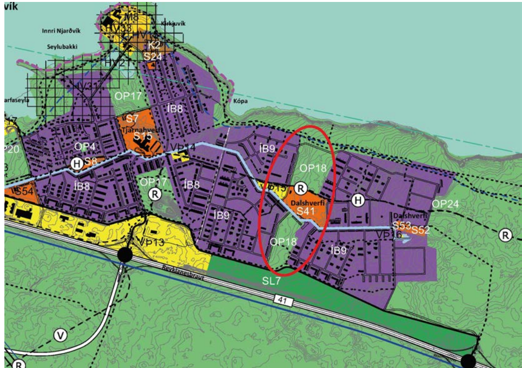
Mynd 6. Gildandi aðalskipulag Reykjanesbæjar:

Aðalskipulagsbreytingin felur í sér breytingu á þéttbýlisuppdrætti.