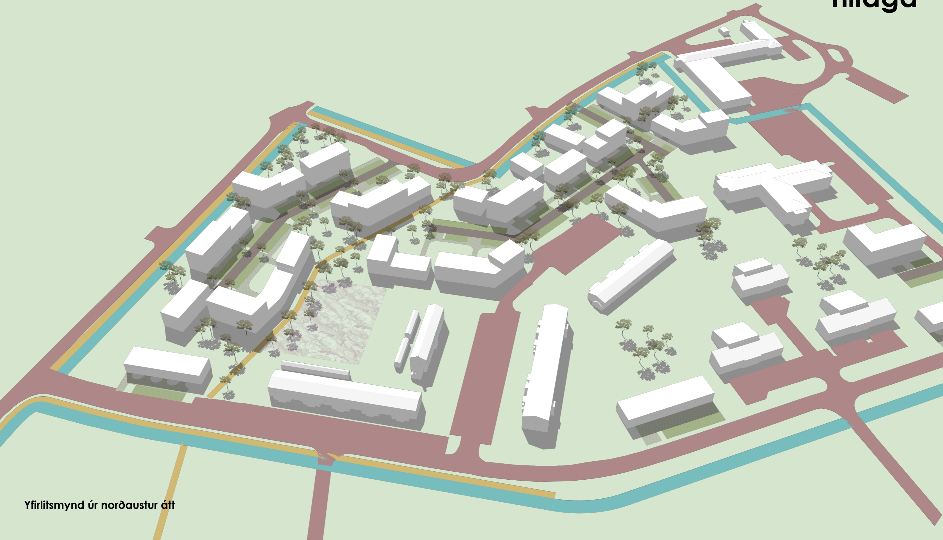
Yfirlitsmynd úr norðaustur átt